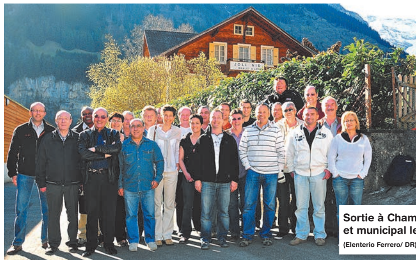
Sortie à Champéry du Conseil général et municipal le 9 avril dernier.