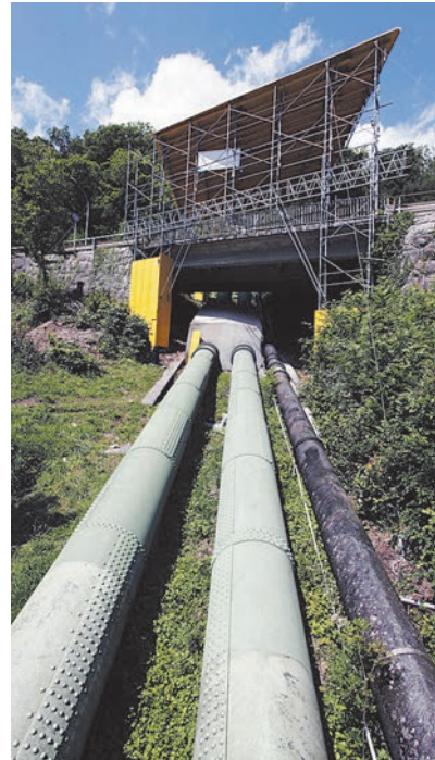
Les travaux préparatoires ont débuté en mai 2011. Ils consistent notamment à sécuriser les routes qui se trouvent au droit des conduites forcées.