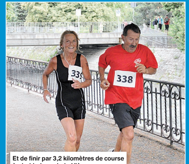
Et de finir par 3,2 kilomètres de course à pied le long de la Vièze.