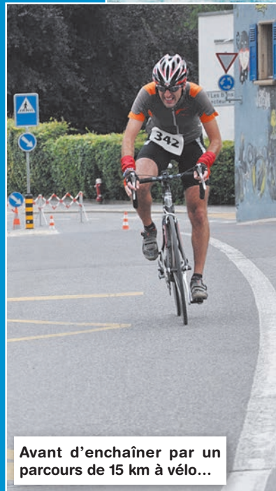
Avant d'enchaîner par un parcours de 15 km à vélo...