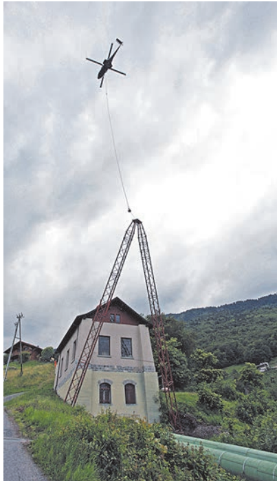
Cinq pylônes ont été ancrés dans le sol, en prévision de l'installation du téléphérique de chantier qui permettra dans un premier temps d'évacuer les anciennes conduites et fondations et par la suite d'acheminer sur le chantier tous les matériaux (bétons, nouvelle conduite, etc..)