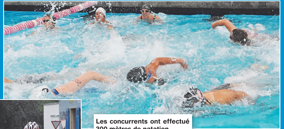
Les concurrents ont effectué 300 mètres de natation...