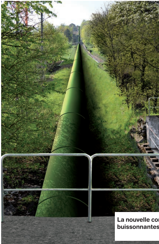
La nouvelle conduite forcée sera dissimulée par des haies buissonnantes pour être mieux intégrée au paysage.

A l'arrêt depuis septembre 2010 pour cause de non-conformité avec les normes de sécurité actuelles, les installations centenaires de l'usine hydroélectrique de la Vièze vont être modernisées. Au printemps 2012, la nouvelle conduite forcée fournira 15% d'énergie en plus.