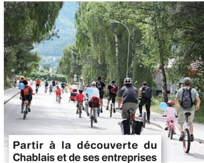
Partir à la découverte du Chablais et de ses entreprises à vélo, tel est le concept de la Fugue chablaisienne.

La Fugue chablaisienne permettra aussi de partir à la découverte du Chablais à travers ses paysages tout en s'arrêtant aux différentes aires d'animation qui seront installées tout au long du parcours. «Ce sera l'occasion de mieux faire connaissance avec des entreprises et des associations de la région comme la Satom, les Transports publics du Chablais, les différents partenaires du site monthey-san ou le Centre mondial du cyclisme à Aigle