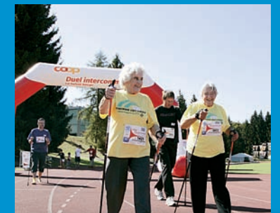
Les activités prévues à Monthey à l'occasion du programme La Suisse bouge s'adressent à des participants de tous âges. (Suisse bouge)