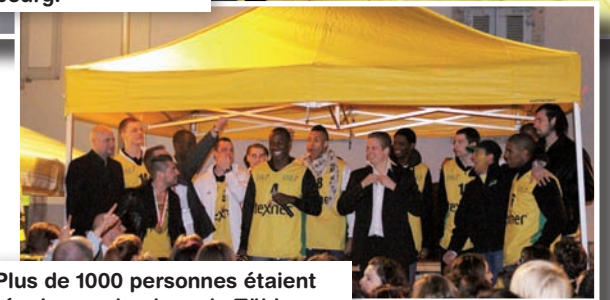
Plus de 1000 personnes étaient réunies sur la place de Tübingen pour accueillir l'équipe.