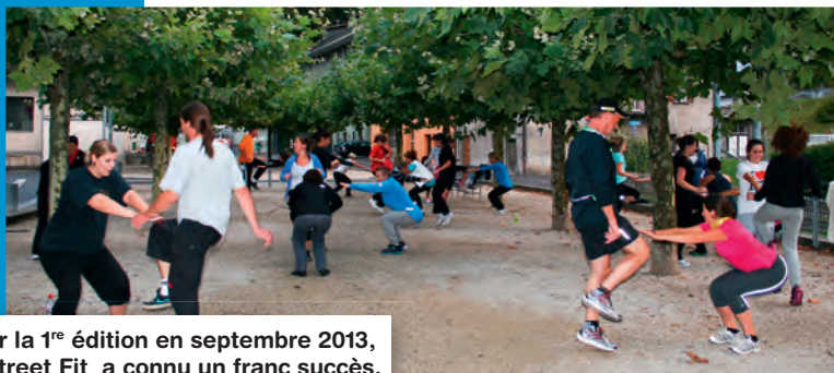
Pour la 1 re édition en septembre 2013, le Street Fit a connu un franc succès.