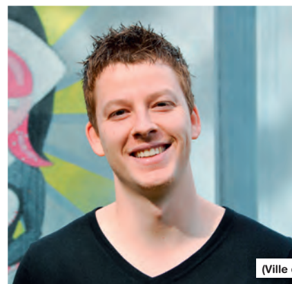
(Ville de Monthey)

puis établir un lien de confiance avec les jeunes. «Mon rôle est d'aller à leur rencontre dans les lieux qu'ils fréquentent de manière à pouvoir leur apporter soutien et les accompagner vers les structures dont ils pourraient avoir besoin», souligne-t-elle.