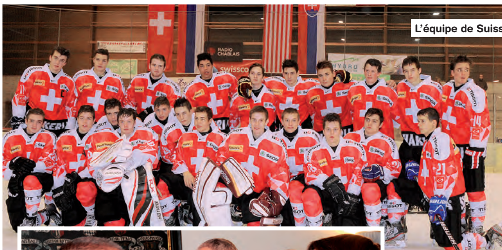
L'équipe de Suisse U17