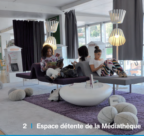
2 | Espace détente de la Médiathèque