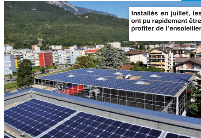
Installés en juillet, les panneaux solaires ont pu rapidement être mis en service pour profiter de l'ensoleillement estival.