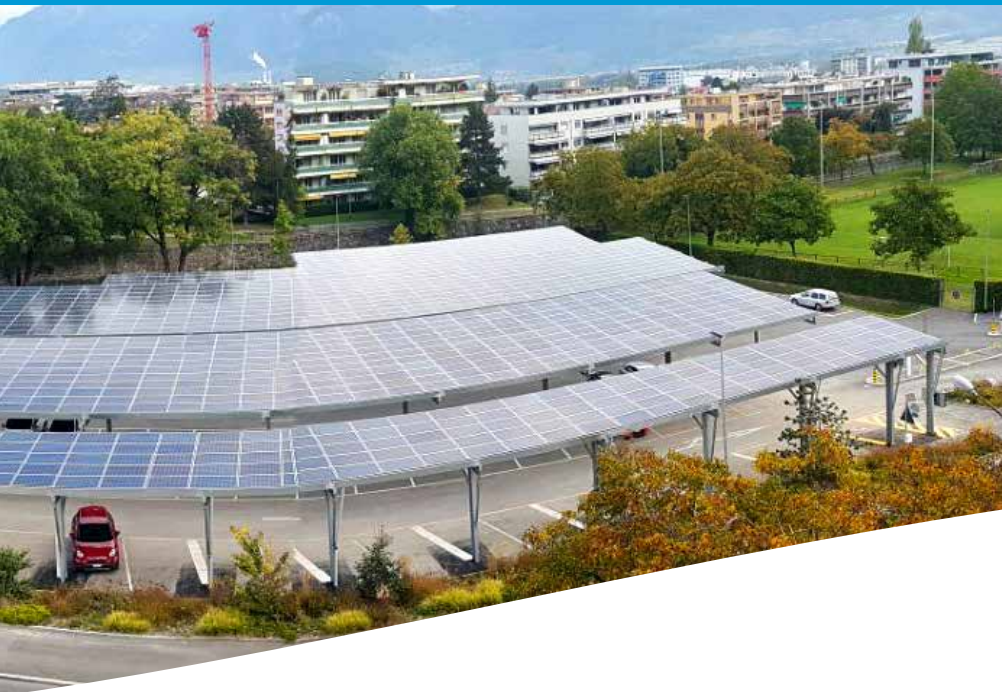
Centrale solaire photovoltaïque de la place d'Armes.